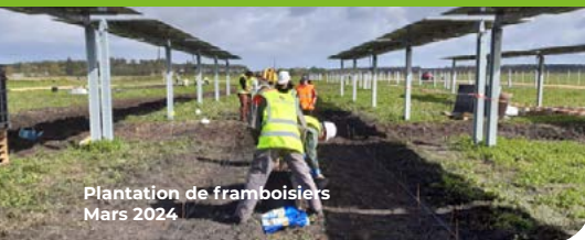
Plantation de framboisiers Mars 2024