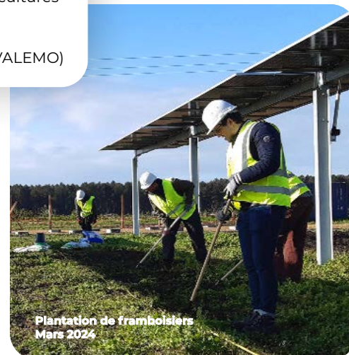
Plantation de framboisiers Mars 2024