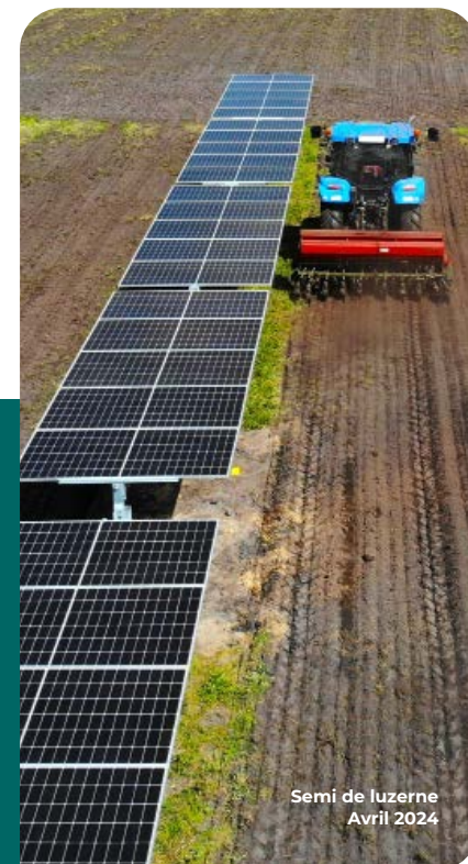
Semi de luzerne Avril 2024