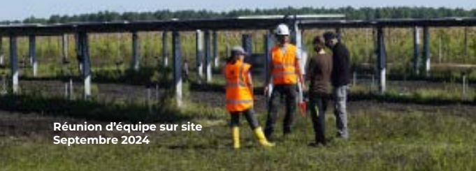
Réunion d'équipe sur site Septembre 2024